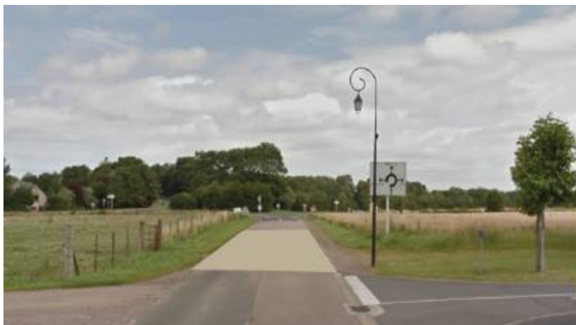
Positionnement envisagé du plateau surélevé Route de Mathieu