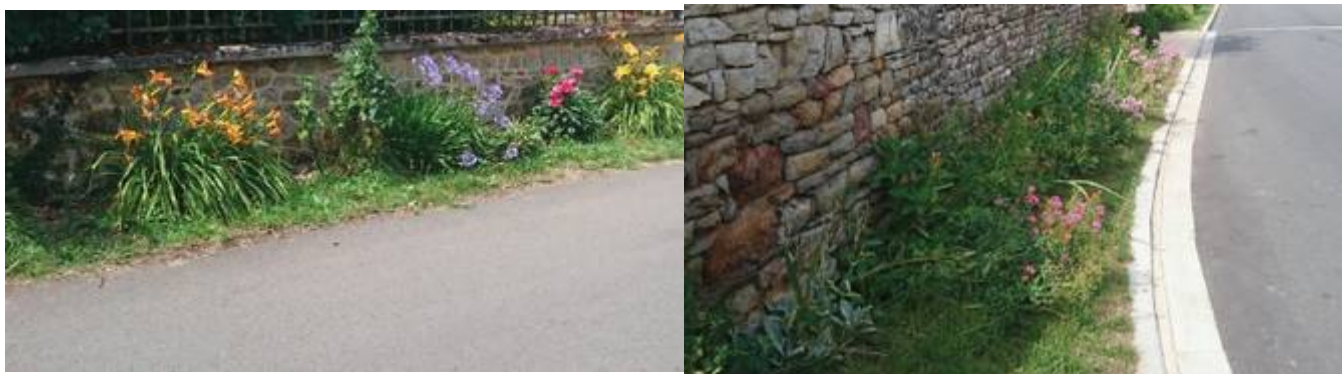
Exemples de fleurissement de pieds de mur